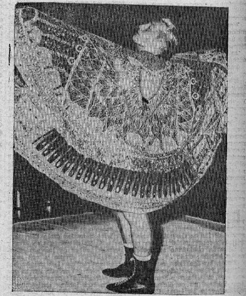
NUOVO TIPO DE CAPA PARA LA LUCHA.—El "joven de la naturaleza" Buddy Rogers, supera a "Georgious George" en sus esfuerzos para acentuar su cuerpo. Rogers trata de que la lucha grecoromana no sea tan fea añadiéndole esta pintoresca capa llamativa.